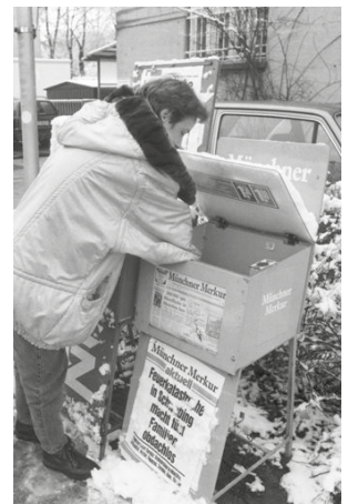
Stummer Verkäufer